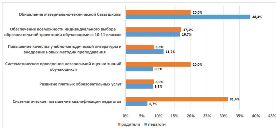
Рис. 3. Направления повышения качества образования (по мнению родителей школьников и педагогов)

В качестве условий, оказывающих наибольшее влияние на качество образования, выступают: применение педагогами современных образовательных технологий (84,0 %); качество образовательных программ (72,0 %), которые следует отнести к объективным факторам обеспечения качества общего образования и к объективным предпосылкам для обеспечения доступности последующего (среднего и высшего) образования.