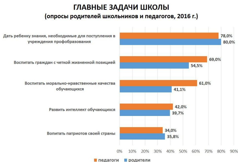
Рис. 2. Главные задачи школы (по мнению родителей школьников и педагогов)

Размышляя о направлениях повышения качества образования, родители и педагоги активно высказывают свои предложения, однако имеют несколько различные точки зрения на данный процесс. Наиболее важным направлением повышения качества образования (по мнению педагогов) является обновление материально-технической базы школы (38,3 %). Однако родители считают, что наибольшее влияние на качество образования оказывает профессиональный уровень педаго-