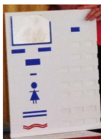
Рис.1. Дидактическое игровое пособие «Полянка родственных слов».

Эффективным коррекционным средством служит метод наглядного моделирования по категориям речи, а также – словообразовательной структуры слов, который особенно важен для дошкольников, поскольку у них преобладает наглядно-образное мышление. Предварительная последовательная работа с детьми со схемами слов, пиктограммами стала первой ступенью для создания дидактического пособия «Полянка родственных слов» (см. рис. 1).