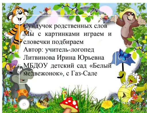
Рис. 3. Титульный слайд к игровой презентации «Сундучок родственных слов»

Как следствие или дополнение к «Полянке родственных слов» был создан интерактивный вариант игры в форме презентации – «Сундучок родственных слов». См. Рис. 3. Мультимедийные и анимационные средства изображения, звука ещё более мотивируют детей, добавляют динамики и эмоциональности восприятия к процессу словообразования.