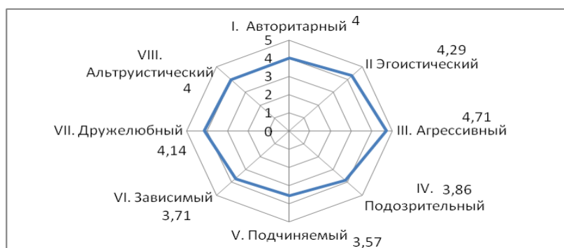
Рис. 2. Показатели средних значений стилей межличностных отношений условных «наблюдателей»

Рассмотрим следующие показатели средних значений стилей межличностных отношений условных «наблюдателей», представленных на рисунке 2.