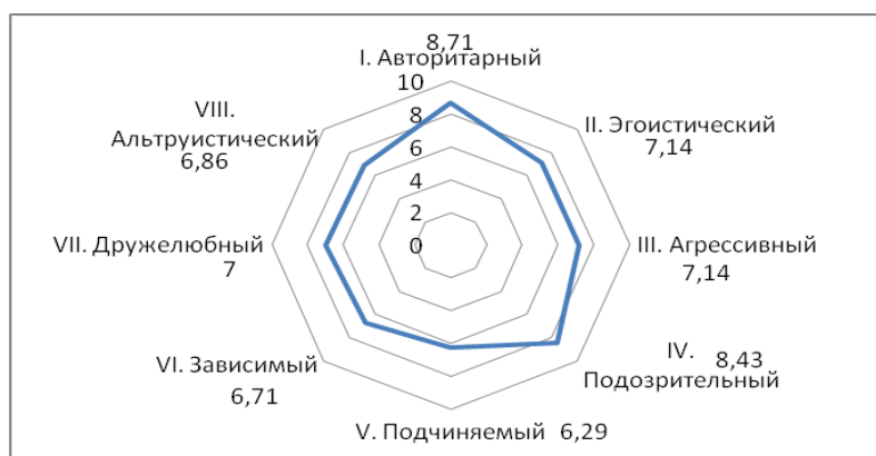
Рис 3. Показатели средних значений стилей межличностных отношений условных «агрессоров»

Далее рассмотрим следующие показатели средних значений стилей межличностных отношений условных «агрессоров» (нападающего), представленных на рисунке 3.