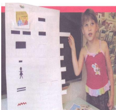
Рис. 2. Пример образования родственных слов от слова «ЧАЙ»: чай – чаи – чаище – чаёк – чайник, чаепитие, чайная, чайхана, чайханщик – чаёвничать – чайная (посуда).

Вот как выглядит игра-пособие: пластиковое (пробный вариант был из двухслойного картона) белое поле 40x50. В левом верхнем углу (над условными значками) расположен прозрачный пластиковый карман для картинка – главного «слова», к которому будут подбираться родственные слова. По левой стороне поля друг под другом располагаются условные обозначения будущих слов: одна прямая горизонтальная полоса – главное «слово», две прямые горизонтальные линии слово, которое говорят, когда «предметов» много, обозначающее большой предмет, маленький прямоугольник – слово, обозначающее уменьшенный предмет, контур человечка – слова, образующиеся от взаимодействия человека с главным словом (кто? что?), две прямые горизонтальные линии – слово-действие (что делает?), красная волнистая линия – слова-признаки (красивые (красные) слова – какой? какая? какое?). На правой стороне поля пособия находятся выдвижные линейки закрывающие окошечки, которые ребенок может открыть, лишь придумав родственное слово. В приложении к пособию прилагается большой яркий конверт с картинками. Примерный набор картинок: рука, след, усы, дорога, сад, лес, старик кот, снег, ухо, собака, сапог, яблоко, хлеб, конь, мост, ночь, барабан, зима, гриб, звезда, земля, Луна. Правильно подобранный наглядный материал обеспечивает высокую познавательную активность детей, позволяет контролировать усвоение знаний и навыков (См. рис. 2).